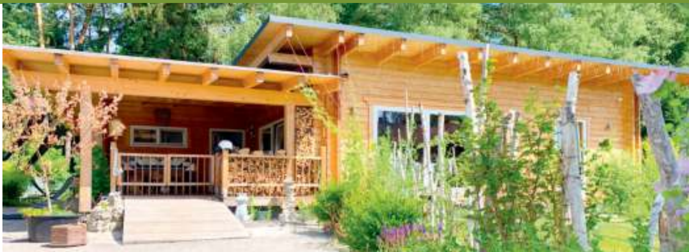
Die Hauseingangsüberdachung wurde von Franz Schweiberer in eigener Arbeit vergrößert und als Veranda erweitert. Ein gemütlicher und geschützter Bereich zum Feiern und Schlafen im Garten wurde geschaffen.