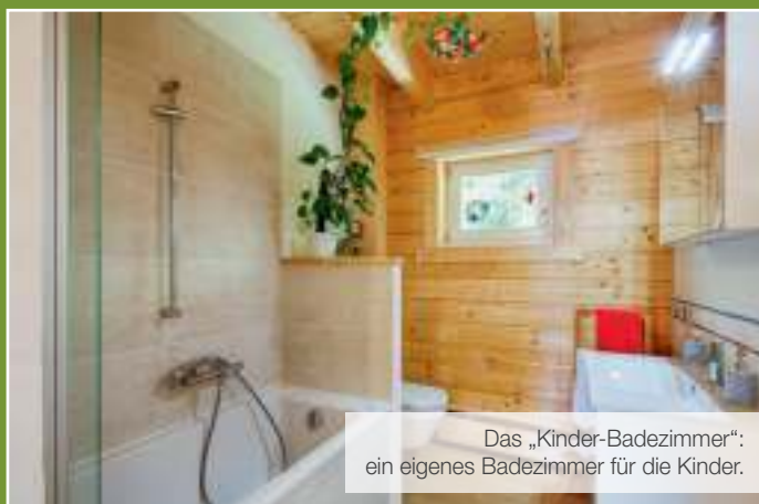
Das „Kinder-Badezimmer“: ein eigenes Badezimmer für die Kinder.