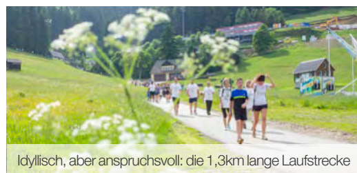
Idyllisch, aber anspruchsvoll: die 1,3km lange Laufstrecke