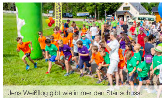
Jens Weißflog gibt wie immer den Startschuss.

Die Rahmenbedingungen stimmten: bestes Wetter, beste Laune und bunte Laufshirts – zum Benefizlauf kamen mehr als 600 Läufer zusammen, um für den guten Zweck zu schwitzen. Die 1,3 Kilometer lange Laufstrecke ist selbst für Profis anspruchsvoll. Gleich zu Beginn geht sie mitten durchs Feld steil bergauf, mehrere Treppen müssen auf- und abwärts überwunden werden, der Belag wechselt von einem schmalen Kiespfad zu Rasen zu Asphalt. Schafe am Rande der Laufstrecke beobachten das Treiben und leisten ihren stummen Beitrag. Eine