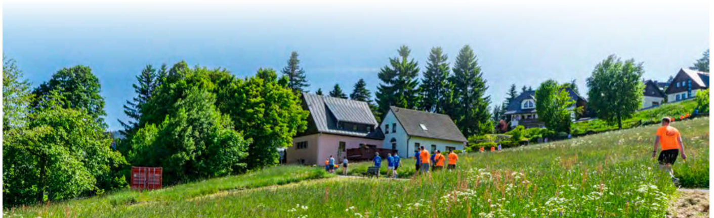
Gleich der Start der 1,3 Kilometer langen Strecke führt steil den Berg hinauf. Treppe auf, Treppe ab.. Cross-Fans kommen auf ihre Kosten.