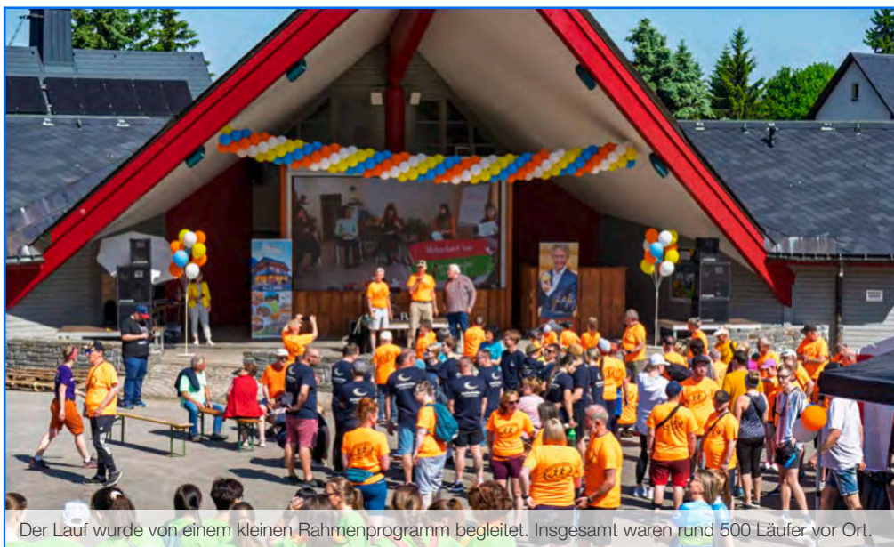
Der Lauf wurde von einem kleinen Rahmenprogramm begleitet. Insgesamt waren rund 500 Läufer vor Ort.