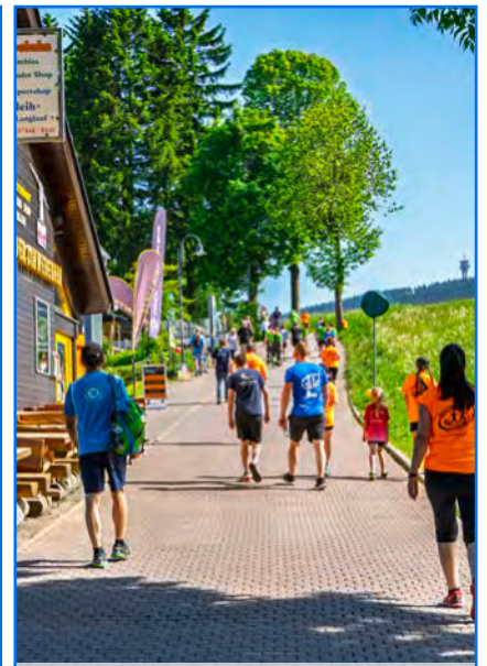
Buntes Treiben auf er Strecke.