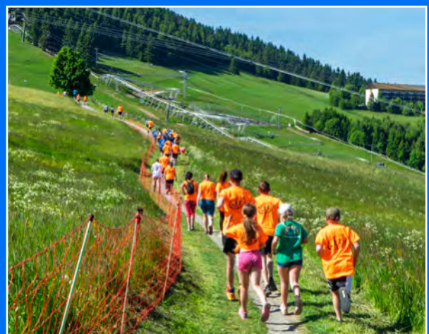
Die bunte Perlenkette zieht ihre Bahnen entlang des Fichtelbergs.