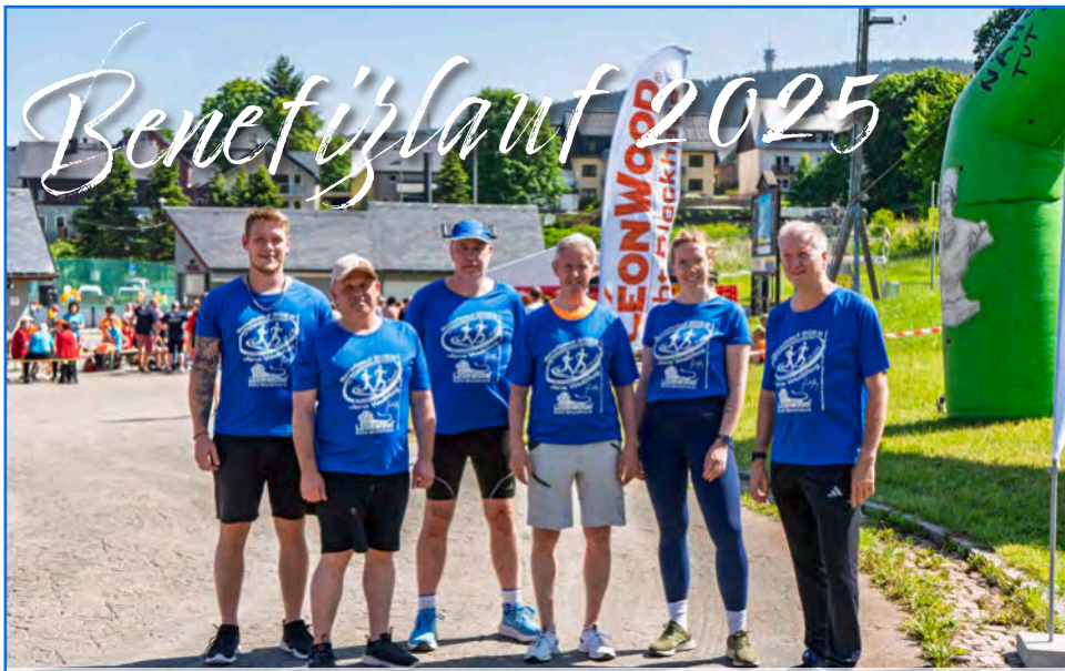
Team LéonWood® vor dem Lauf. Am Ende werden sie gemeinsam fast 30 Kilometer gelaufen sein.