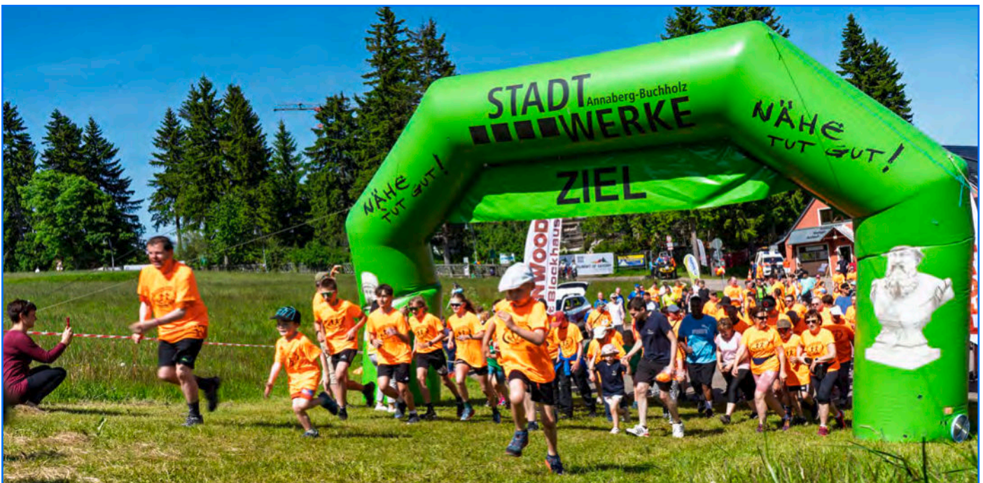
Startschuss zum 14. Benefizlauf in Oberwiesenthal durch Schirmherr Jens Weißflog: Jung und Alt laufen gemeinsam für den guten Zweck.