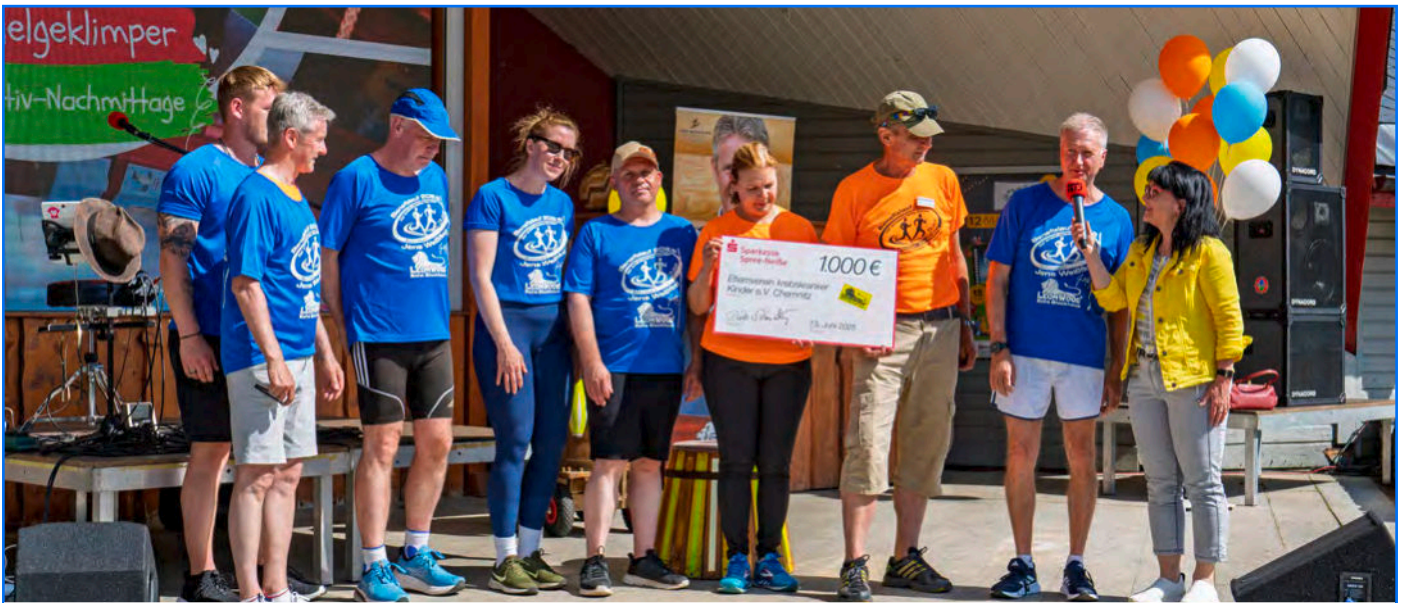
Dieses Mal gemeinsam auf der Bühne: Team LéonWood® übergibt den Scheck im Wert von 1.000€ an den Elternverein krebskranker Kinder e.V. Chemnitz.