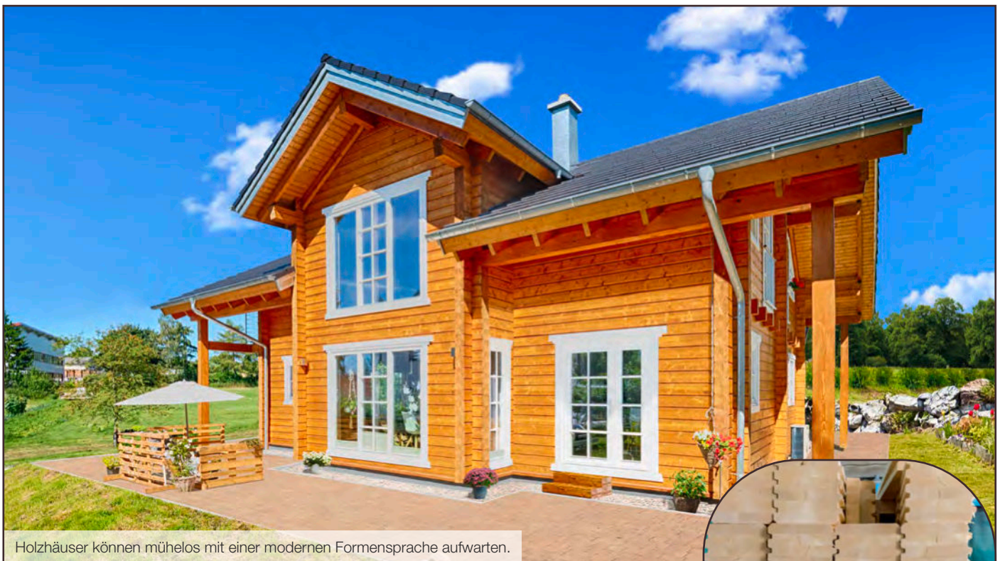
Holzhäuser können mühelos mit einer modernen Formensprache aufwarten.