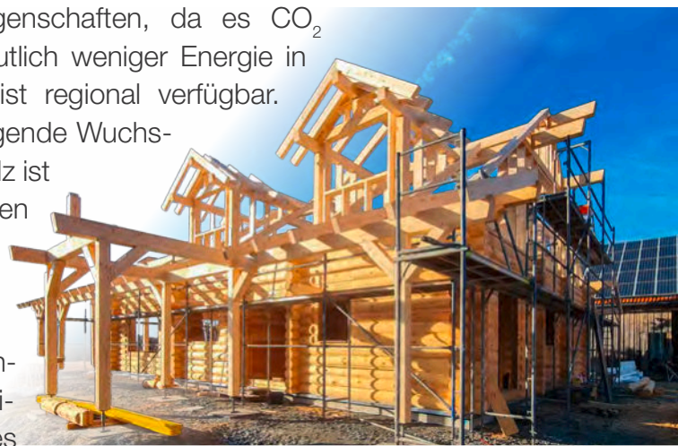
Baustoff Holz: schon im Aufbau beeindruckend.

Holz überzeugt durch seine klimafreundlichen Eigenschaften, da es CO 2 speichert und im Vergleich zu Beton oder Stahl deutlich weniger Energie in der Herstellung benötigt. Holz wächst nach und ist regional verfügbar. Besonders im nördlichen Europa herrschen hervorragende Wuchsbedingungen für Kiefern- oder Fichtenholz. Dieses Holz ist aus unterschiedlichen Gründen besonders gut für den Holzhaus- bzw. speziell den Blockhausbau geeignet. Eine hohe Vorfertigung im Holzbau ermöglicht präzises, effizientes und vor allem schnelles Bauen, was angesichts steigender Baukosten und Fachkräftemangel zunehmend an Bedeutung gewinnt. Auch die politische und gesellschaftliche Diskussion um nachhaltiges Bauen stärkt den Holzbau. Förderprogramme und gesetz-