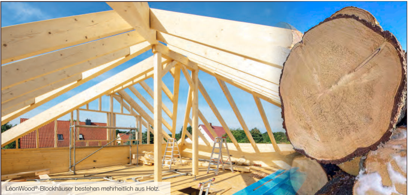
LéonWood®-Blockhäuser bestehen mehrheitlich aus Holz.

liche Rahmenbedingungen – etwa die angestrebte Klimaneutralität im Gebäudesektor – begünstigen den Einsatz von Holz.