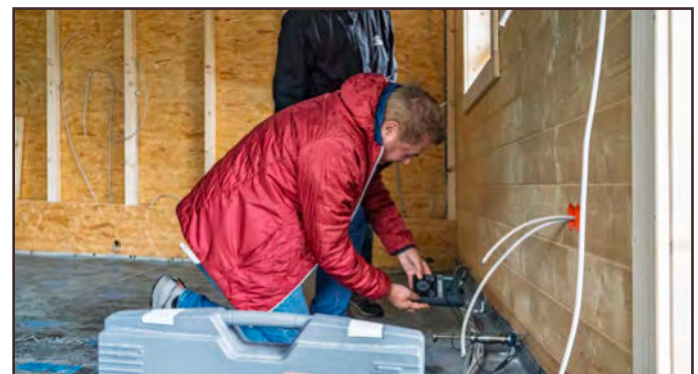
Auch beim fertiggebauten Blockhaus ist die Holzfeuchtemessung eine zentrale Methode, um die Qualität der Montage zu prüfen.