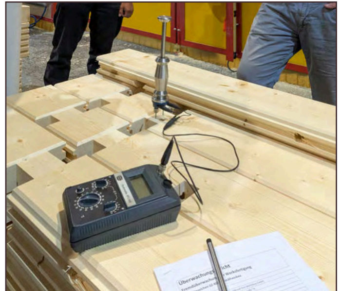
Jede Messung der Holzfeuchte wird akribisch protokolliert und ausgewertet. Ein Wert zwischen 12 und 15% ist optimal.