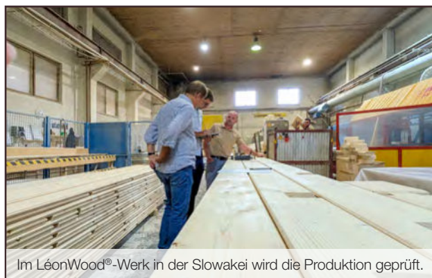
Im LéonWood®-Werk in der Slowakei wird die Produktion geprüft.

Geprüft wird seit Jahren durch den öffentlich bestellten und vereidigten Sachverständigen für Holzhausbau Josef Egle. Er leitet die Überwachungs- und Zertifizierungsstelle für die RAL-Gütezeichen, welche Holzbau-Unternehmen einen hohen technischen Standard sowie die Dauerhaftigkeit und den Werterhalt ihrer