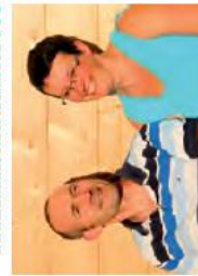
Glückliches Bauherren-Paar: Mit dem Entwurf „Sienna“ ist stölicher Charme für das Zuhause garantiert.

Frank Siebold www.zuhause3.de/leonwood ●●●