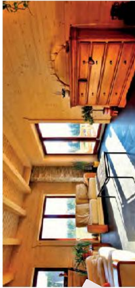
Holz, Fliesen und viel Licht geben dem Wohnbereich Charme.