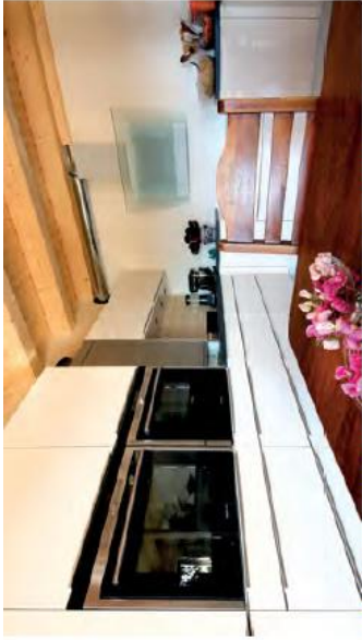
Mit 55 Quadratmetern bietet die Küche reichlich Platz für Familie und Freunde.