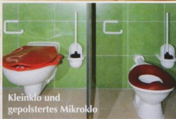
Kleinklo und gepolstertes Mikrolo