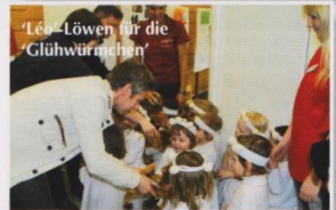
‘Léo-Löwen für die Glühwürmchen’