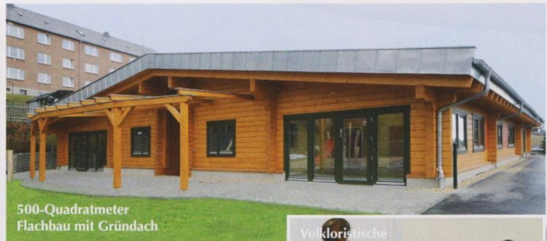
500-Quadratmeter Flachbau mit Gründach