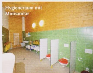
Hygieneraum mit Minisanitär