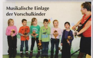
Musikalische Einlage der Vorschulkinder