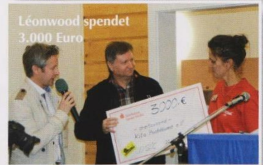
Léonwood spendet 3.000 Euro