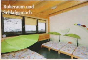
Ruheraum und Schlafgemach