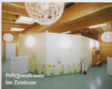
Polygonalraum im Zentrum

Der ebenerdige Blockbau der Wald- und Natur-Kindertagesstätte hat eine Grundfläche von 25 mal 20 Metern. Die Blockwände bestehen aus 20 Zentimeter starken Vierkant-Balken, für die der Hersteller das erforderliche Brandschutzgutachten vorlegen konnte.