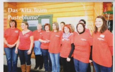
Das ‘Kita-Team Pusteblume’