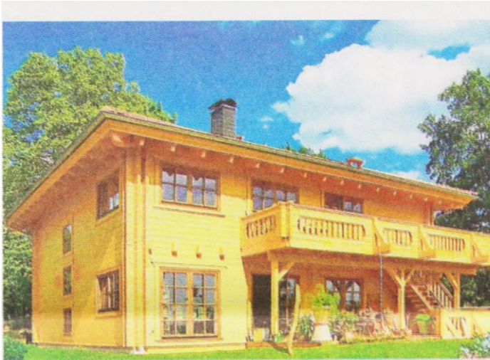
Die Villa Certaldo steht für den modernen Blockhausbau.