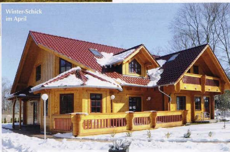
Winter-Schick im April

Eberswalde hat zwar sechs Schiffschleusen, wird aber heute mehr noch von den ausgedehnten Wäldern mit allein zehn Quadratkilometern Stadtforst und