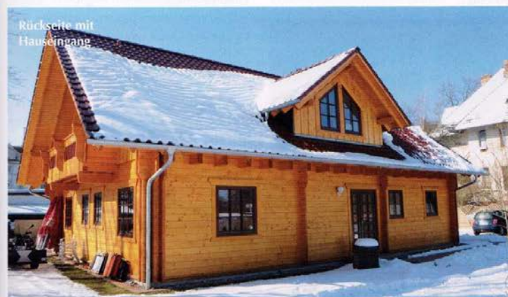
Rückseite mit Hauseingang

Die Architektur des 'Wilden Ebers' ließe sich auch gut als privates Wohnblockhaus umsetzen und könnte manchem Gast eine Inspiration für's eigene Bauvorhaben sein. Blockhausfans können hier quasi Probewohnen und sind besonders herzlich willkommen. Berlin ist von Eberswalde über die Autobahn oder per Zug nur 45 Minuten entfernt. Das Hotel ist daher auch für Städtereisende geeignet, die preiswert, gut und ruhig in einem persönlichen Ambiente übernachten möchten. BH