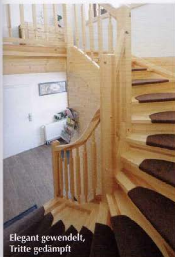
Elegant gewandelt, Tritte gedämpft