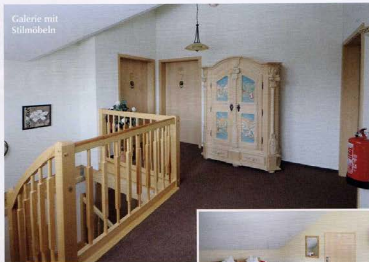
Galerie mit Stilmöbeln

Interessant ist, wie die Doppelblock-Vorköpfe an den Hausecken wirken. Während die Hausecken ringsum den Doppelblock zeigen, stehen am Balkon nur die äußeren Balken hervor und fassen ihn damit ein. Die massiven Innenwände sind als Einfachblock mit den Außenwänden verkämmt. Ebenso wie die zahlreichen, gleichmäßig verteilten Deckenbalken stehen sie mit Vorköpfen aus der Fassade hervor. Das außen mit einer Schweizer Öllasur gestrichene Haus hob sich im April mit herrlich warmem Rotton vom reichlich gefallenem Osterschnee ab. Ähnlich beeindruckend leuchten die Farben bei der durchdachten nächtlichen Illumination von Haus und Garten, die das Blockhotel von gewöhnlichen Wohnhäusern glanzvoll abhebt.