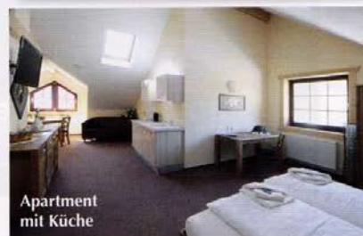
Apartment mit Küche

Die Architektur des 'Wilden Ebers' ließe sich auch gut als privates Wohnblockhaus umsetzen und könnte manchem Gast eine Inspiration für's eigene Bauvorhaben sein. Blockhausfans können hier quasi Probewohnen und sind besonders herzlich willkommen. Berlin ist von Eberswalde über die Autobahn oder per Zug nur 45 Minuten entfernt. Das Hotel ist daher auch für Städtereisende geeignet, die preiswert, gut und ruhig in einem persönlichen Ambiente übernachten möchten. BH