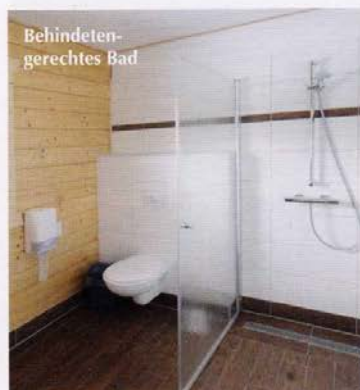
Behinderten- gerechtes Bad

Auf dem Hauptdach sorgen vorn und hinten Gauben für mehr Aussicht, Dachfenster bringen zusätzlich Licht. Vorne um den Erker herum bis zum Querhaus ist das Gebäude mit einer umlaufenden Veranda eingefasst, die das gleiche Blockbohlen-Geländer wie der Balkon trägt. Alle Fenster und Terrassentüren sind mit Sprossen versehen und braun gestrichen.