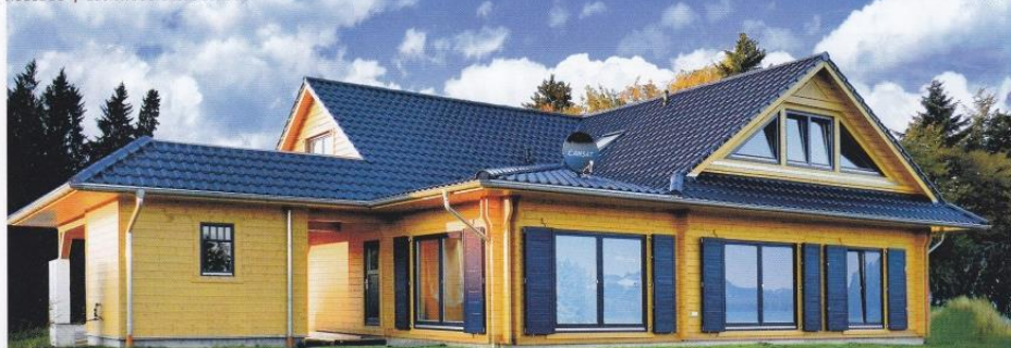
Hausbau | Leonwood Great Canada