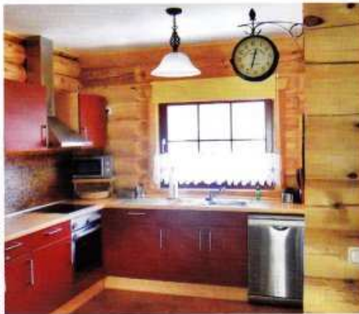
11. Léon-Wood High-Blockhaus

Mitten in der Lausitzer Heide, nahe Görlitz, dort, wo auf einer Fläche von 5 Hektar Heidelbeeren geerntet werden, steht das Haus „Mustikka“. „Mustikka“ ist finnisch und heißt Blaubeere. Der Name ist für LéonWood® eine Verbeugung vor der Natur und Anspielung auf die Verwurzelung dieses Entwurfs aus Rundbohlen – industriell verarbeitete Baumstämme. Die kastanienfarbene Fassade mit den roten Fenstern mutet romantisch, fast ein wenig märchenhaft an. Vom großen Balkon, der über dem Haupteingangsbereich thront, reicht der Blick weit übers Land. Knapp 158 Quadratmeter Wohnfläche verteilen sich auf zwei Etagen. Alle Räume des Blockhauses sind in heller Naturfarbe belassen. Kräftige Farben, wie rotbraune Fliesen und viel Rot bei der Küchen- und Wohnausstattung, bringen Nestwärme und Lebendigkeit ins Geschehen. Der offene Wohn-Ess-Bereich, der auch über die von Pfeilern gestützte Terrasse zugänglich ist, wurde durch die Diele von der Küche und dem Arbeitsbereich getrennt.