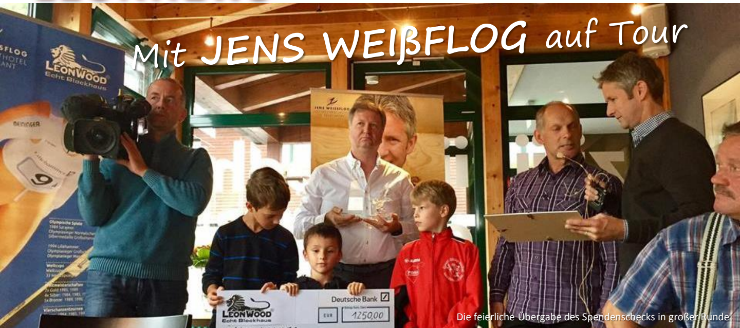
Die feierliche Übergabe des Schecks in großer Runde