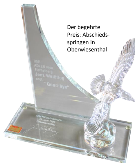
Der begehrte Preis: Abschiedsspringen in Oberwiesenthal

Schon 20 Jahren ist es her, dass Jens Weißflog seinen Skianzug an den sprichwörtlichen Nagel gehängt hat. „Schon?“ möchte man sagen, denn vielen ist der Floh vom Fichtelberg noch erfolgreich auf der Schanze in Erinnerung. Wenn auch nicht mehr sportlich aktiv, hat sich Deutschlands Skisprung-Legende vor besagten 20 Jahren ein neues berufliches Standbein aufgebaut: Jens Weißflog ist Hotelier. Und dies mit Leib und Seele und immer nah am Urlauber. Ruft man im Hotel an, kann es durchaus sein, dass sich der Chef höchst persönlich am anderen Ende der Leitung meldet und die Reservierung aufnimmt. Dort angekommen, wuselt der ehemalige Weltklasseskispringer im ganzen Haus umher, hält ein Schwätzchen mit den Gästen, ist immer präsent. Wen verwundert es also, dass sich sein JENS WEIßFLOG APPARTEMENT HOTEL bereits zwei Jahrzehnte erfolgreich im erzgebirgischen Skisport-Mekka Oberwiesenthal behaupten kann. Ein Grund – das Alleinstellungsmerkmal – hat Weißflog der Firma LéonWood® zu verdanken: die Relax Lodge in Rundstamm-Bauweise, die seit Ende 2013 den Hotelkomplex ergänzt. Seit 2014 ist Jens Weißflog auch Markenbotschafter des Blockhaus-Experten mit Sitz in der Metropolregion Berlin-Brandenburg.