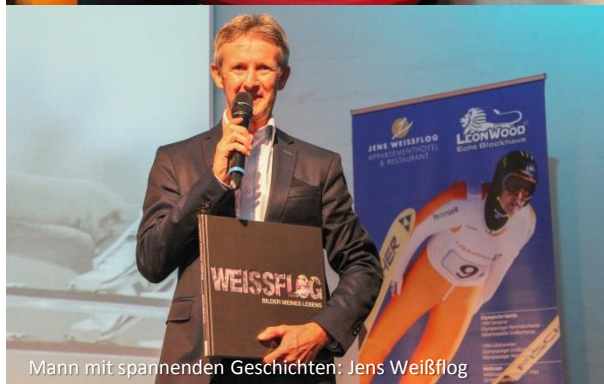
Mann mit spannenden Geschichten: Jens Weißflog