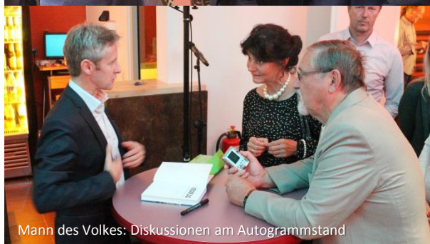
Mann des Volkes: Diskussionen am Autogrammstand