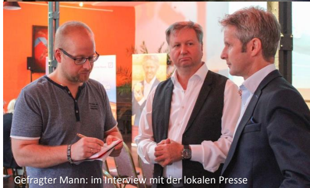
Gefragter Mann: im Interview mit der lokalen Presse