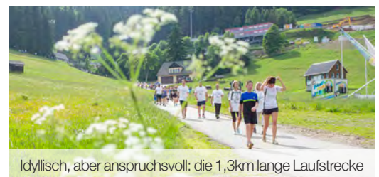
Idyllisch, aber anspruchsvoll: die 1,3km lange Laufstrecke