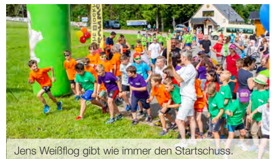
Jens Weißflog gibt wie immer den Startschuss.

Die Rahmenbedingungen stimmten: bestes Wetter, beste Laune und bunte Laufshirts – zum Benefizlauf kamen mehr als 600 Läufer zusammen, um für den guten Zweck zu schwitzen. Die 1,3 Kilometer lange Laufstrecke ist selbst für Profis anspruchsvoll. Gleich zu Beginn geht sie mitten durchs Feld steil bergauf, mehrere Treppen müssen auf- und abwärts überwunden werden, der Belag wechselt von einem schmalen Kiespfad zu Rasen zu Asphalt. Schafe am Rande der Laufstrecke beobachten das Treiben und leisten ihren stummen Beitrag. Eine