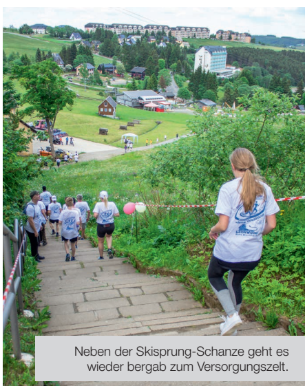
Neben der Skisprung-Schanze geht es wieder bergab zum Versorgungszelt.