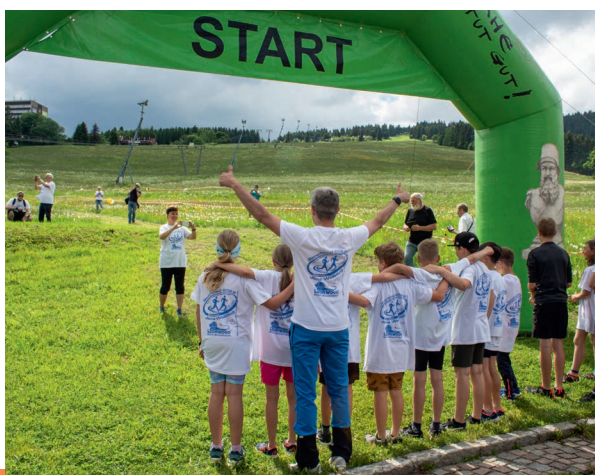
Gruppenfoto kurz vor dem Startschuss mit LéonWood®-Markenbotschafter und Schirmherr des Benefizlaufs Jens Weißflog.

Zudem werden nun seit neun Jahren über 500 Laufshirts von LéonWood® zu jedem Benefizlauf gesponsert, jedes Jahr eine andere Farbe. Schirmherr Jens Weißflog hat sich dieser Aktion seit einigen Jahren ebenfalls angeschlossen. In diesem Jahr präsentierten sich die Benefizlauf-Teilnehmer im weißen Shirt mit