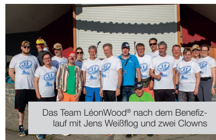
Das Team LéonWood® nach dem Benefizlauf mit Jens Weißflog und zwei Clowns