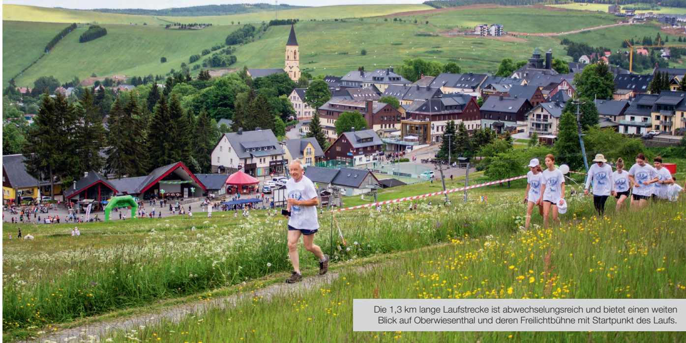
Die 1,3 km lange Laufstrecke ist abwechslungsreich und bietet einen weiten Blick auf Oberwiesenthal und deren Freilichtbühne mit Startpunkt des Laufs.