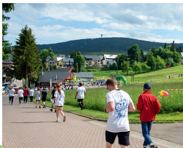
Insgesamt nahmen rund 1.000 Läufer am Benefizlauf 2022 teil - in Oberwiesenthal und im Heimatort.

Pro gelaufene Runde, gab es Bares für den guten Zweck! Jeder konnte selbst entscheiden, wie viele Runden gelaufen werden. Die 14 anwesenden Mitarbeiter von LéonWood® liefen zusammen insgesamt 69 Runden, darunter absolvierte der Geschäftsführer