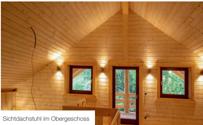
Sichtdachstuhl im Obergeschoss