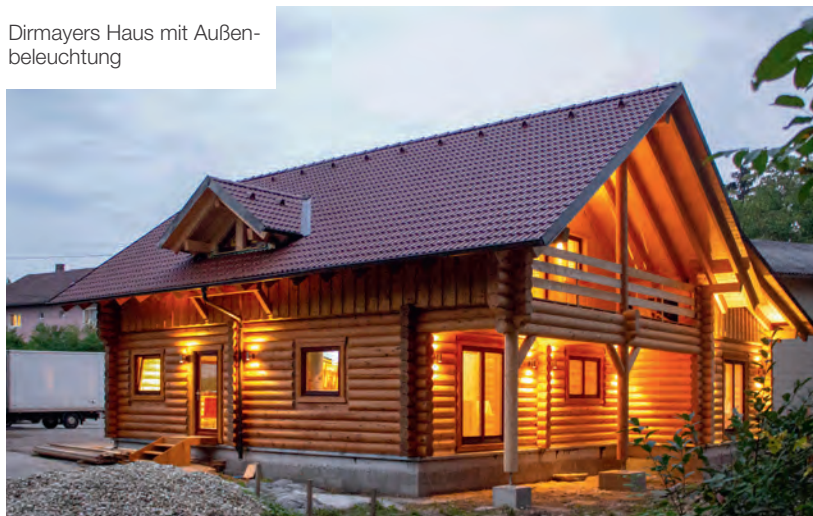
Dirmayers Haus mit Außenbeleuchtung