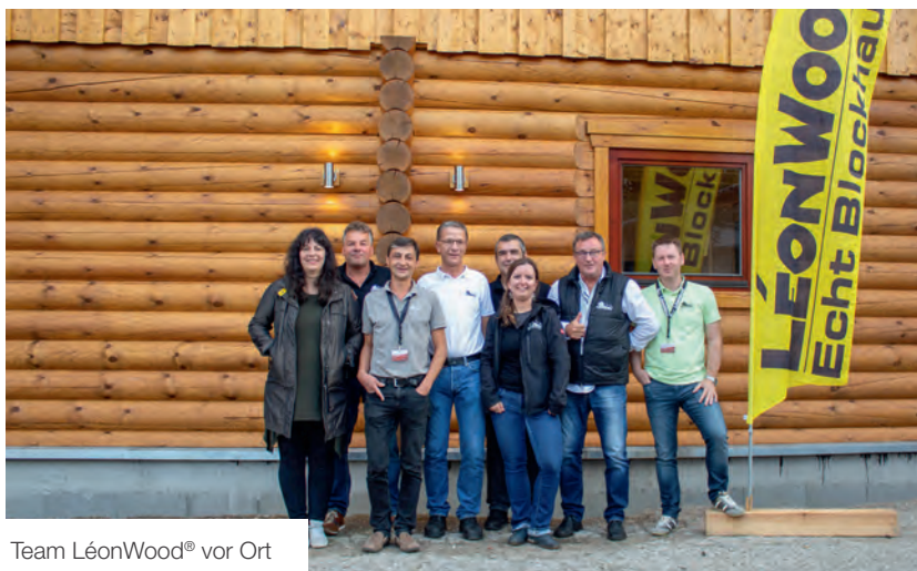
Team LéonWood® vor Ort

LéonWood® bedankt sich bei allen Beteiligten für die warme Gastfreundschaft und die ausgesprochen familiäre Betreuung. Der Blockhaus-Experte wird auch in Zukunft weitere Blockhaustage bzw. Infoveranstaltungen durchführen.