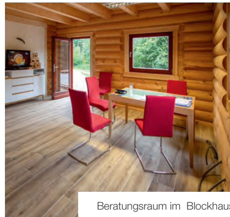
Beratungsraum im Blockhaus