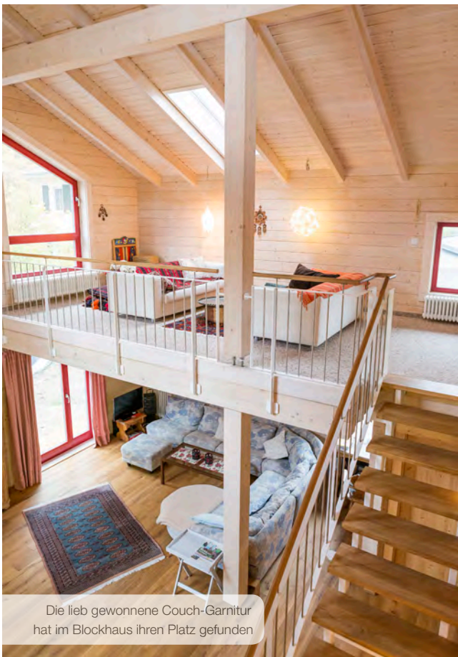
Die lieb gewonnene Couch-Garnitur hat im Blockhaus ihren Platz gefunden

Blockhaus-Typ: FALCON GREY Grundriss: 11,11 x 11,52 Meter Baustoff: Bio-Doppelwand® DuoPlus 2x68mm Blockbohle massiv, Fichte 132mm Dämmstoffraum für Korkgranulat Innenwände: 90mm Blockwand Fenster und Türen: Kiefer Fenster: Wärmeschutzglas, 3-fach-verglast Dach: Doppelpultdach Besonderheiten: Blockhausecken als Tiroler Schloss Bio-Doppelwand wurde bis unters Dach verbaut -> Dämmung des Kniestocks mit Kork Massivholz-Innentüren im Landhausstil von LéonWood®, Fichte Galerie Blockhauslasur LeoColor Konstruktiver Holzschutz durch große Dachüberstände Liefertermin: 27.05.2014