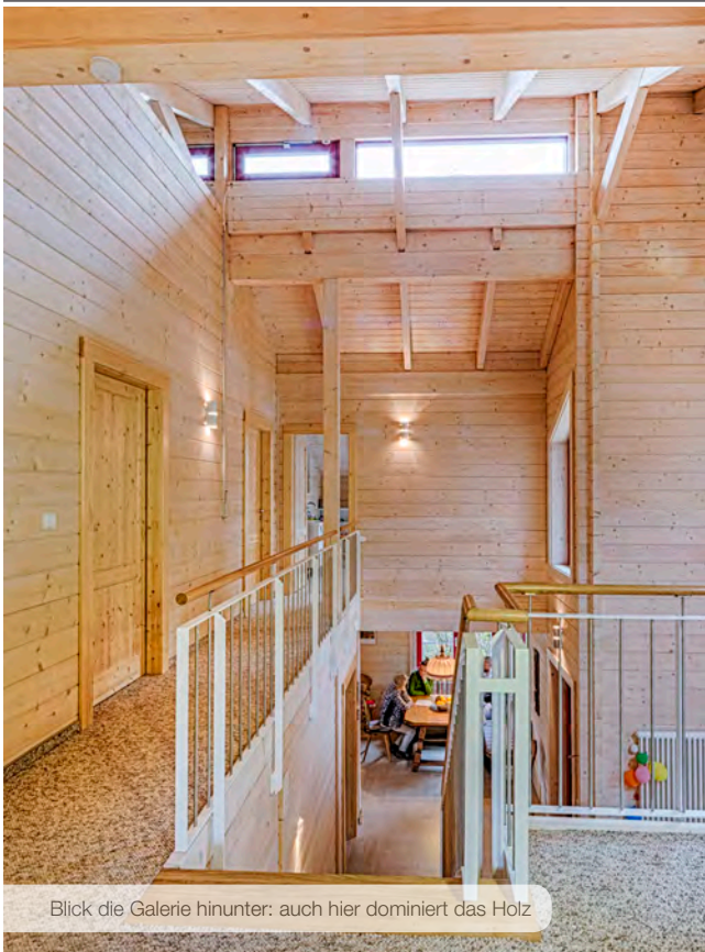
Blick die Galerie hinunter: auch hier dominiert das Holz