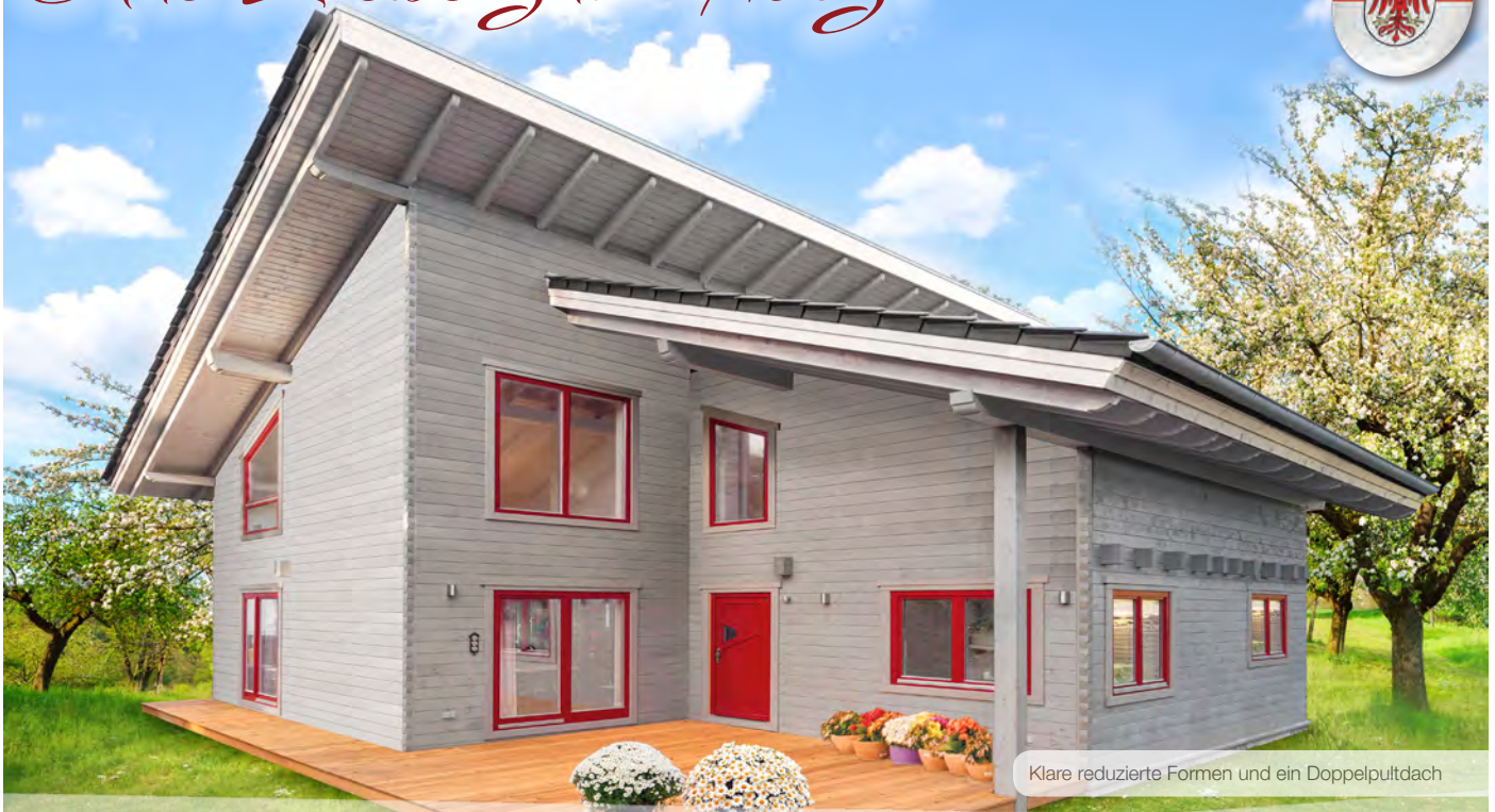
Klare reduzierte Formen und ein Doppelpultdach