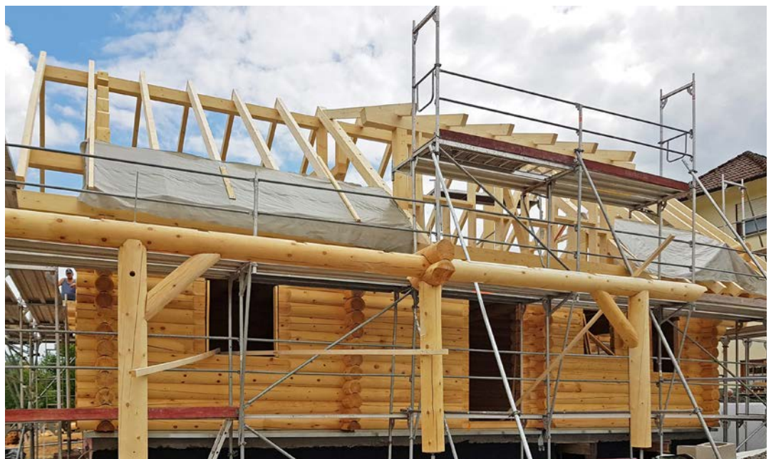
..... Abgeschlepptes Carport an der Traufseite mit Hauseingang