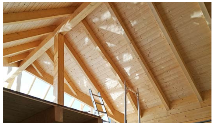
..... Sichtdachstuhl mit gehobelten Sparren

Im Blockhaus Ontario von LéonWood® wohnt es sich hell und offen. Der T-förmige Grundriss mit klassischem Satteldach und drei Giebeln bietet viel Wohnraum in lichtdurchfluteter Atmosphäre . Nach kanadischem Vorbild in traditioneller Rundstammbauweise gefertigt, kommt dieses Blockhaus ohne weitere Dämm- oder Hilfsstoffe aus. Die 25cm starken Kiefernstämme schaffen trotz des einschaligen Wandaufbaus ein behagliches und natürliches Raumklima .